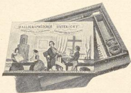
Kalligraphischer Unterricht (Spiel aus der Mitte des 19. Jahrh.).

Zu diesen kleinen Beschäftigungsspielen können wir auch das Buchstaben- oder A-B-C-Spiel zählen. Solche Spiele zum Zusammensetzen von Worten durch Buchstaben aus Elfenbein und Buchsbaum kannte man schon im klassischen Altertum. Die alten Germanen legten Runen aus Stäbchen, und der be-