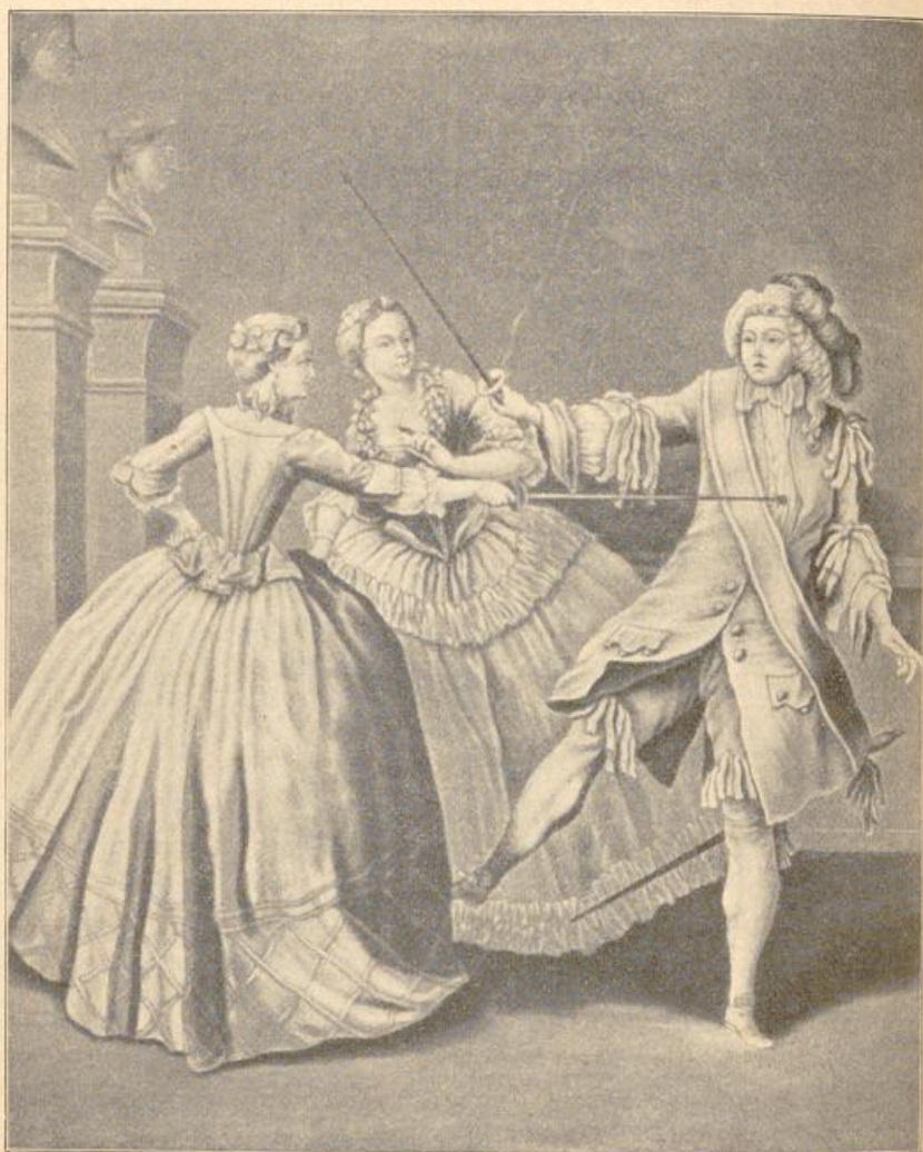
Florettfechten im 18. Jahrhundert.

man kann mit Fechtstunden allmählich die Scheu vor Schlag und Stich und vor dem Kampf überhaupt zu überwinden