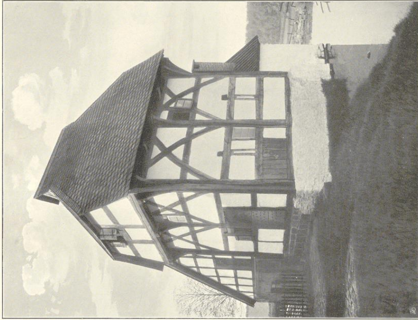
Aufnahmen von 1909.