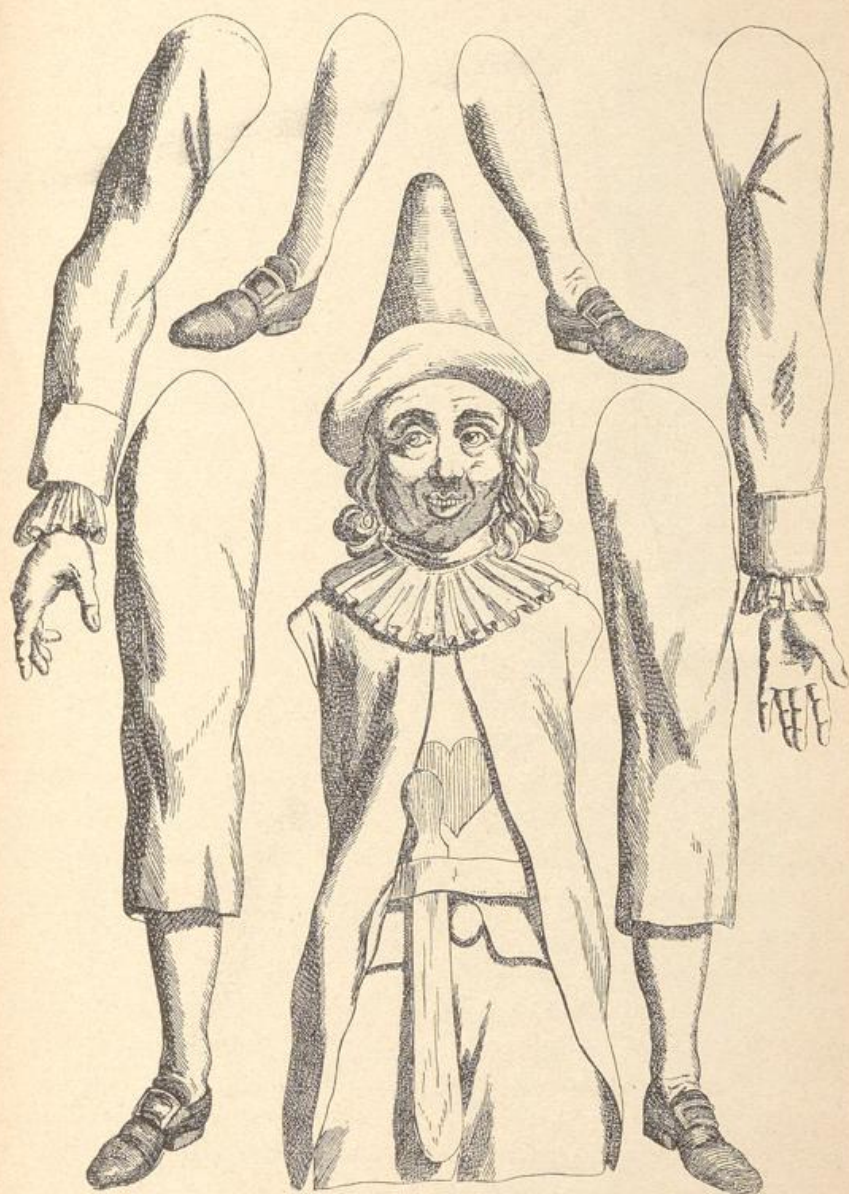
Hampelmann, 18. Jahrhundert.