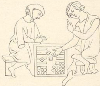
Nach Strutt Sports and Pastimes.

Ein Brettspiel, das besonders interessant gewesen zu sein scheint, das aber nicht mehr existiert und dessen Spielweise auch nicht mehr bekannt ist, war das Philosophen-Spiel, das noch im 16. Jahrhundert in England mit viereckigen, dreieckigen und runden, mit Zahlen beschriebenen schwarzen und