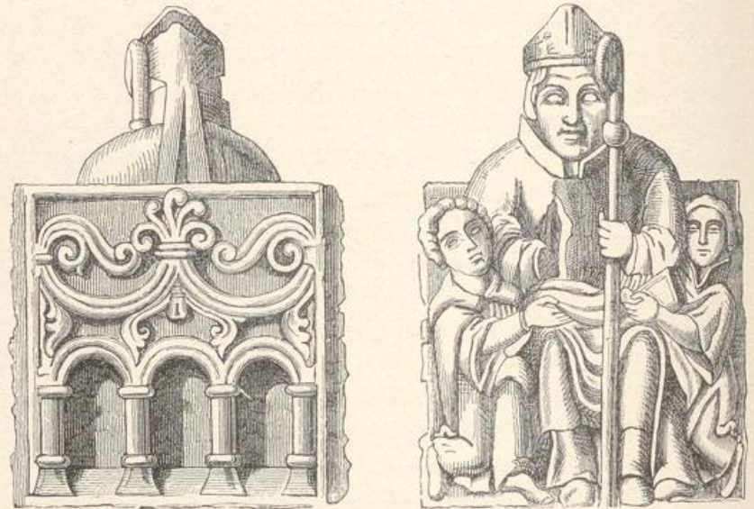
Aus der Sammlung der Deutschen Gesellschaft zu Leipzig.