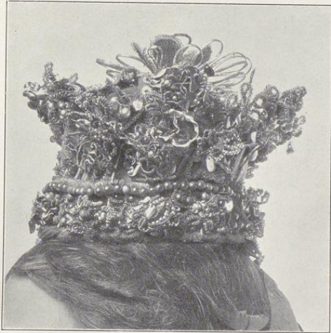
Brautfrone aus Lohne.