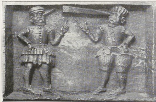
Relief (Nothert, Soest), von einem Fachwerkhause, Renaissance, 16. Jahrhundert, von Holz, geschnitten. Darstellung des Gleichnisses vom Splitter und Balken, Bergpredigt. 85 cm breit, 55 cm hoch.