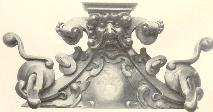
Siehe Nachträge: Lippstadt, Sammlung Mumme, Seite 148.