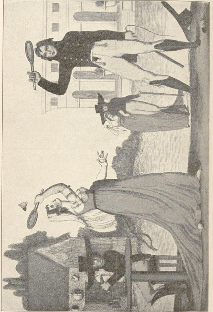
Federballspiel im Jahre 1800.