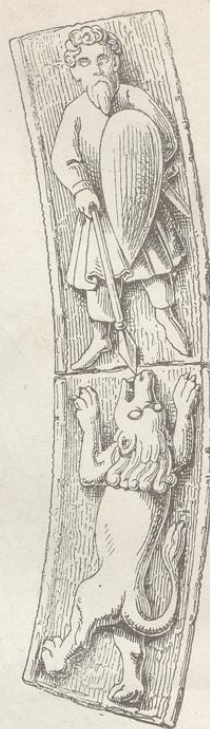
Fig. 225. (Záboř.)

Die hier vorfindlichen Bildhauereien gehören zwei verschiedenen Perioden an, einer frühern mit der Ausführung der Jacobs-Kirche gleichzeitigen, und einer bedeutend späteren, wie gelegentlich des dortigen Portal-Baus angegeben wurde. Im alten Theile der Zábořer Kirche haben sich einige mit Menschen- und