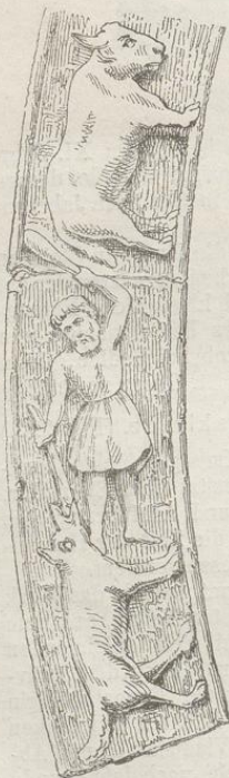
Fig. 224. (Záboř.)

Das Relief ist aus Prager Mergelstein hergestellt, ziemlich erhaben, die Behandlung ängstlich und hart, doch zeigt die Anordnung des Ganzen ein entwickeltes Liniengefühl und Sinn für Gruppierung. Die heil. Jungfrau sitzt auf einem mit Würfel-Capitälen und andern romanischen Ornamenten ausgestatteten Thronsessel und umfängt das Kind mit beiden Händen, während zwei in der Luft schwebende Engel ihr die Krone aufsetzen. An den Stufen des Thrones knien zwei Benedictiner-Nonnen in Ordenstracht. Wie in alten Bildwerken, besonders an Malereien herkömmlich, ist die Figur Mariens, namentlich Gesicht und Hals ungleich besser gezeichnet und edler durchgebildet, als die übrigen Theile, unter denen das puppenartige Kind und die eckigen Engel bei weitem als die schwächsten Leistungen bezeichnet werden dürfen. Im Faltenwurf, welcher zwar nach Art des XII. Jahrhunderts hier