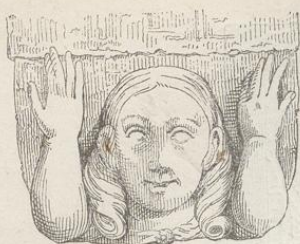
Fig. 223. (Záboř.)

✠ MARIA . PRIMA . ABBA ✠ AVE . MARIA . GRACIA PLENA . DNS . TĚ . CVM ✠ BĚRHTA . ABBA . SC . . . . F . . . .