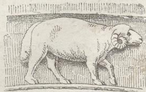
Fig. 226. (Záboř.)