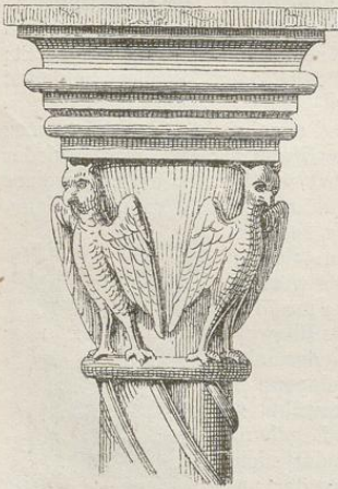
Fig. 230. (Podvinec.)

Beinahe noch ärmlicher und kunstloser zeigen sich die Sculpturen in Podvinec, obgleich hier der trefflichste Sandstein die Arbeit erleichtert hätte. Wie an den Capitälern zu Eger, blieb die Bildhauerkunst weit hinter der Architektur zurück. Die beiden auf den freien Säulen des Porticus befindlichen Capitäle sind mit Vögeln sonderbarsten Ansehens ausgestattet, welche vielleicht Adler vorstellen sollen, aber zu Eulen geworden sind. Auch das im Thürsturze angebrachte Relief, ein Crucifix zwischen Engeln, befremdet sowohl wegen seiner Härte und schülerhaften Ausführung, als der ungewöhnlichen Darstellungsweise. Christus, mit den Händen auf das Kreuz genagelt, steht mit den Füßen frei auf dem Boden, als wolle er vorwärts schreiten: daneben liegen zwei Figuren (Engel) mit Heiligenscheinen auf der Erde und unterstützen die Füße des Gekreuzigten. Die Zeichnung der nackten Körpertheile verräth bei aller Dürftigkeit, dass der Bildhauer die Natur zu Rathe gezogen habe: Rippen und Musculatur der