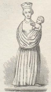
Fig. 231. (Mohelnie.)

Die schon erwähnten, dem oberen Geschoße der Doppel-Capelle angehörenden Capitäle sind mit den betreffenden Bauthteilen so eng verbunden, dass deren Abbildungen in dem vorhergehenden Abschnitte bereits gegeben werden mussten; es bleibt daher für hier nur übrig, die Behandlungsweise und künstlerische Durchbildung der figürlichen Darstellungen zu erklären. Wie bereits angedeutet, stehen diese weit hinter den Pflanzen-Ornamenten zurück; die Figuren gleichen in der That Götzenbildern, wofür sie immer gehalten worden sind, und vom Volke noch immer gehalten werden. Von allen sind die beiden im Architektur-Abschnitte abgebildeten nackten Gestalten nicht allein des obscönen Inhalts, sondern auch der verunglückten Zeichnung wegen