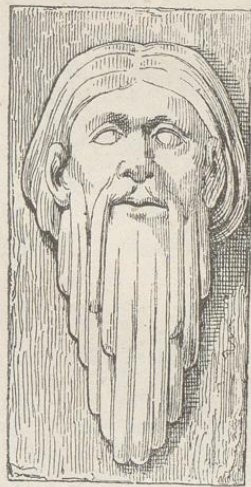
Fig. 232. (Rudig.)

der Züge jede Schlussfolgerung gewagt, da die Büste vermöge des darüber angebrachten Simses als Tragstein diene. Die Bilder sind kolossal, 18 Zoll hoch und fast ebenso breit. Frappanter noch erscheint ein am Gewände der Thurmthüre in Rudig angebrachter, sorgfältig ausgeführter Kopf mit langem Bart und gescheiteltem Haar, dessen Bedeutung zwar vergessen worden ist, der aber jedenfalls historische Wichtigkeit besitzt. Die Höhe beträgt 20, die Breite 10 Zoll, die Ausführung ist sehr scharf und eigenthümlich. Fig. 232 Kopf in Rudig, Fig. 233 angebliches Bild des Herzogs Soběslav I. in Arnau, Fig. 234 zweite Büste daselbst.