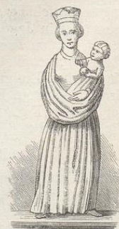
Fig. 231. (Mohelnie.)

Die schon erwähnten, dem oberen Geschoße der Doppel-Capelle angehörenden Capitäle sind mit den betreffenden Bauthteilen so eng verbunden, dass deren Abbildungen in dem vorhergehenden Abschnitte bereits gegeben werden mussten; es bleibt daher für hier nur übrig, die Behandlungsweise und künstlerische Durchbildung der figürlichen Darstellungen zu erklären. Wie bereits angedeutet, stehen diese weit hinter den Pflanzen-Ornamenten zurück; die Figuren gleichen in der That Götzenbildern, wofür sie immer gehalten worden sind, und vom Volke noch immer gehalten werden. Von allen sind die beiden im Architektur-Abschnitte abgebildeten nackten Gestalten nicht allein des obscönen Inhalts, sondern auch der verunglückten Zeichnung wegen