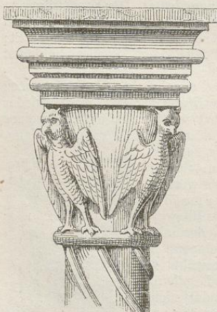
Fig. 230. (Podvinec.)

Beinahe noch ärmlicher und kunstloser zeigen sich die Sculpturen in Podvinec, obgleich hier der trefflichste Sandstein die Arbeit erleichtert hätte. Wie an den Capitälern zu Eger, blieb die Bildhauerkunst weit hinter der Architektur zurück. Die beiden auf den freien Säulen des Porticus befindlichen Capitäle sind mit Vögeln sonderbarsten Ansehens ausgestattet, welche vielleicht Adler vorstellen sollen, aber zu Eulen geworden sind. Auch das im Thürsturze angebrachte Relief, ein Crucifix zwischen Engeln, befremdet sowohl wegen seiner Härte und schülerhaften Ausführung, als der ungewöhnlichen Darstellungsweise. Christus, mit den Händen auf das Kreuz genagelt, steht mit den Füßen frei auf dem Boden, als wolle er vorwärts schreiten: daneben liegen zwei Figuren (Engel) mit Heiligenscheinen auf der Erde und unterstützen die Füße des Gekreuzigten. Die Zeichnung der nackten Körpertheile verräth bei aller Dürftigkeit, dass der Bildhauer die Natur zu Rathe