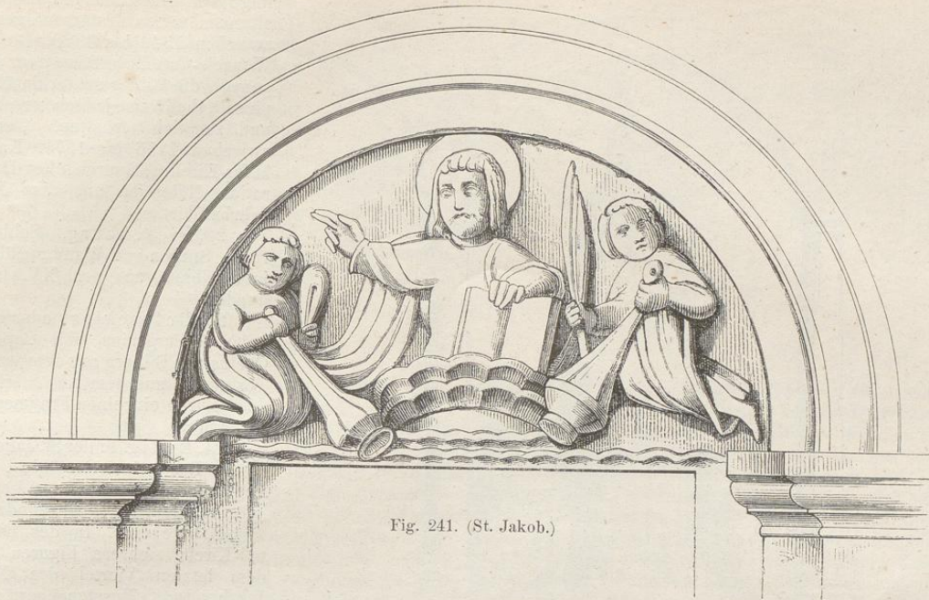
Fig. 241. (St. Jakob.)

Den meisten Wandmalereien des XII. Jahrhunderts ist eine gewisse Weichheit eigen, welche um so beachtenswerther erscheint, als die mit schwarzen Contouren vorgezeichneten und leicht colorirten Bilder zu scharfen Faltenbrechungen und sonstigen Härten mehr als hinreichenden Anlass boten.