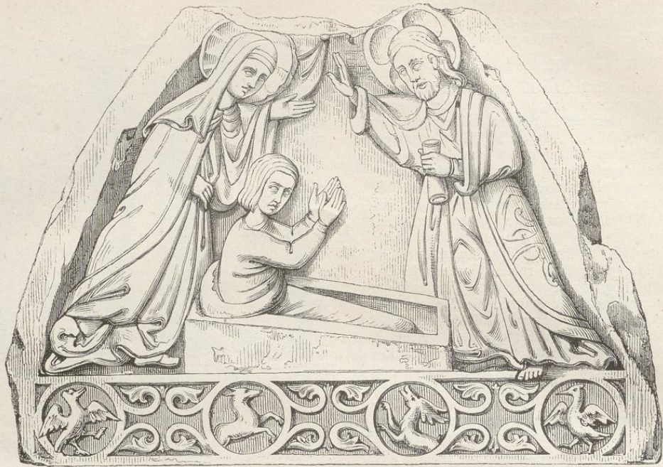
Fig. 240. (Prag.)

fertigerin des geschilderten Stein-Altars war. Der sorgsame Fleiss, welcher sich in allen Theilen ausspricht, eine gewisse durchziehende Ängstlichkeit und vor allen Dingen die ausserordentliche Genauigkeit der Nonnenkleidungen verrathen eine weibliche Hand. Weder der erfindungsreiche Hajek noch irgend ein Chronist nennt anderweitige Bildhauer.