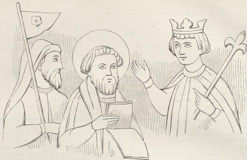
Fig. 244. (Prag.)

einzelnen Figuren und Decorations-Theilen zu sehen. Die Altersbestimmung der in diesen Räumen befindlichen Malerwerke wird durch die Baugeschichte sehr erleichtert: die Bilder im Altarraum gehören dem Beginne, die im Presbyterium dem Schlusse des XIII. Jahrhunderts an.