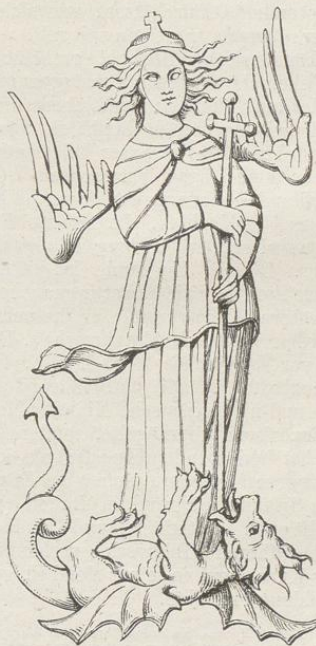
Fig. 246. (Selčan.)

Dieses Gebilde weicht insofern von den bisher beschriebenen ab, als es nur mit schwarzen, ziemlich