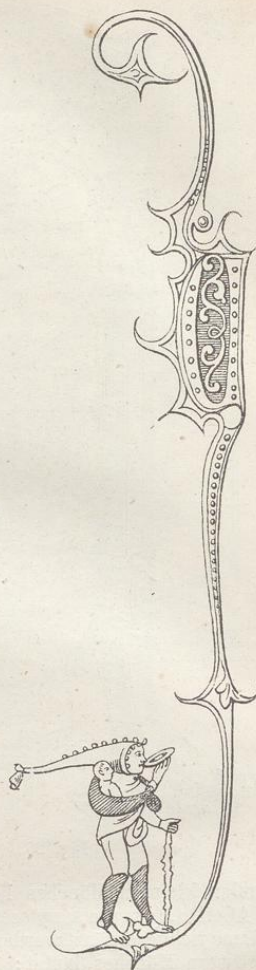
Fig. 265. (Prag.)

Nur in einzelnen Zeichnungen sind Theile mit Lasur-Farben ausgefüllt, z. B. die Heiligenscheine, Kronen und Embleme gelb, die Rüstungen lichtblau, die Kleider hervorragender Personen roth, grün oder violett. Die meisten Blätter des neuen Testaments und