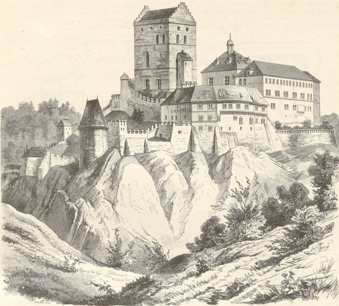
Fig. 66. (Karlstein.)

dem Vorhofe und Zwinger, wo die Beamtenwohnungen, Wirthschaftsräume und der Brunnenturm untergebracht waren, dann zweitens aus der eigentlichen Burg und Kaiserwohnung, welche mit dem dritten Compartment, der Collegiatkirche Maria Himmelfahrt durch eine Brücke in Verbindung stand, und endlich aus dem grossen Thurm mit der Kaiser- oder Kreuz-Capelle.