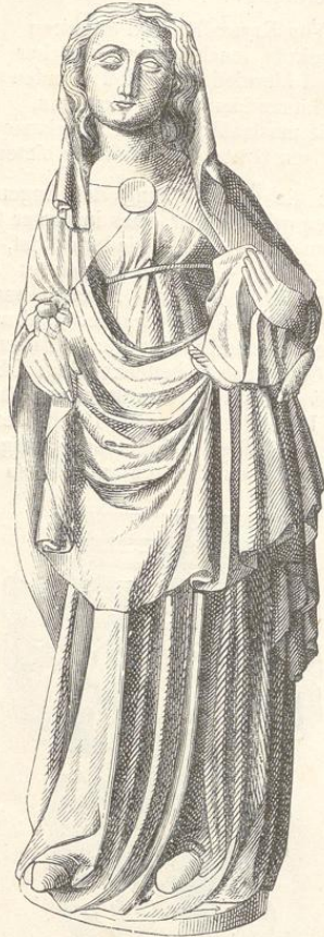
Fig. 77. (Karlst.)

Wenn auch die Katharinacapelle viel besser erhalten ist, als die eben beschriebene Kreuzcapelle, macht doch diese in ungleich höherem Grade den Eindruck einer ausserordentlichen und fremdartigen Pracht, welche insbesondere durch die fast zahllosen, gleichmässig vertheilten Tafelbilder verstärkt wird. Es ist in diesen Bildern kein