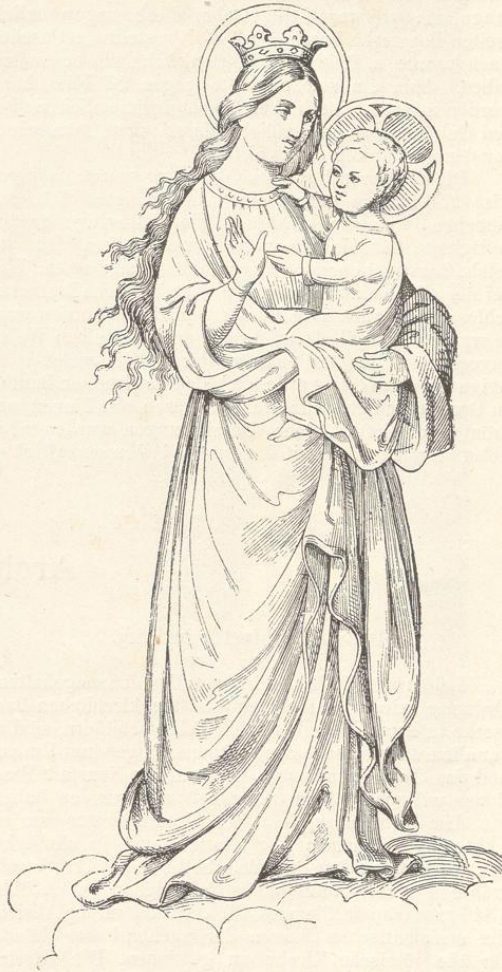
Fig. 79. (Karlstein.)

plastischen Schmuck war hier ebenso wenig, als in den von Meister Mathias ausgeführten Theilen des Prager Domes angetragen. Die bereits ausgesprochene Vermuthung, es habe diesem Künstler der nöthige Sinn für Plastik gemangelt, erhält in Karlstein volle Bestätigung. Da Mathias die Burg gründete und den Bau von 1348 bis 1352 leitete, scheint er den Rohbau in der Hauptsache vollendet zu haben, so dass sein Nachfolger im Amte, der Meister Peter, wenig Gelegenheit fand, sculptirte Decorationen anzubringen. Mit Ausnahme von vier sehr schön gearbeiteten, mit Laubwerken und Thiergestalten verzierten Consolen, die in den Ecken