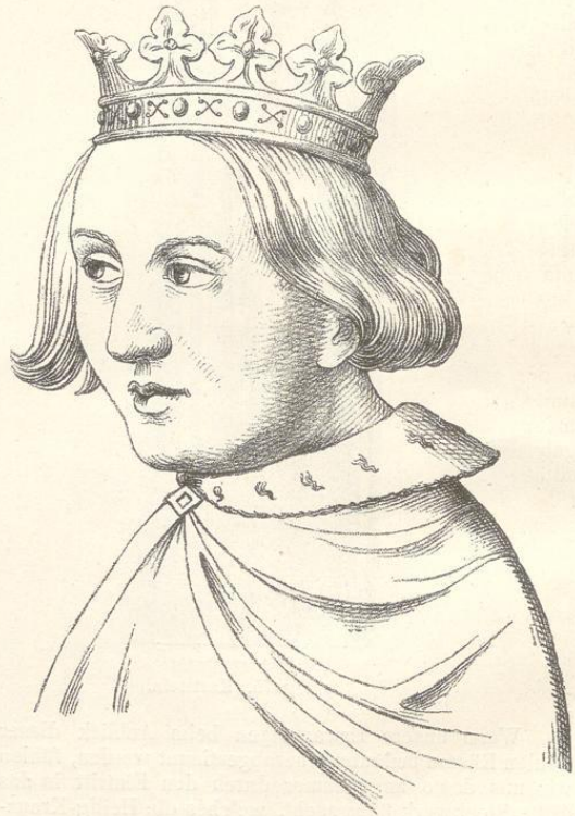
Fig. 78. (Karlst.)

Malweise und Auffassung dieser Bilder, als deren Urheber der Meister Theodorich documentirt ist, nehmen eine durchaus eigenthümliche Stellung in der mittelalterlichen Kunstgeschichte ein, indem weder eine Annäherung an die italienischen, noch an die damals blühenden deutschen Schulen wahrgenommen werden kann. Die Köpfe erscheinen im Verhältniss zu den Körperformen übergross, die Gesichter aufgedunsen und mit grossen, dabei verschobenen Nasen ausgestattet. Die Farbe der Fleischtheile hat einen seltsam weissgrauen Schimmer, so dass die mit starren Augen aus den Rahmen blickenden Gestalten ein gespensterhaftes Ansehen besitzen. Dabei sehen die Gewänder aus wie aus Leder gefertigt, die Farben sind der lichten Seite zugekehrt und dünnflüssig aufgetragen, die Schatten nur leicht mit verblasenen schwarzen Tönen angedeutet. Am meisten fällt die Behandlung der Haare auf, welche Theodorich, abweichend vom Gebrauche seiner Zeit, nicht mit einzelnen feingezogenen Linien abschattirt, sondern als wollige glattvertriebene Massen darstellt. Im Vergleich mit der geistreichen Conception und der fortgeschrittenen Technik, welche sich in den Gemälden der Marienkirche kundgeben, nehmen die Bilder