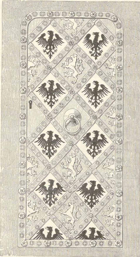
Fig. 80. (Karlstein.)

Durch ein Rechteck von 76 Fuss Breite und 152 Fuss (also doppelter) Länge wird der Grundriss des Kirchenhauses im Lichten beschrieben, über welche Grundform nur die Chor-Abschlüsse sowohl des Hauptschiffes wie der beiden Nebenschiffe vortreten. Einen Thurm besass die Kirche ursprünglich nicht, zwei dormal an der Westfronte bestehende Thürme wurden erst während der Regierung des Königs Wenzel IV. ohne besondere Fundamentirung in das hinterste Gewölbejoch