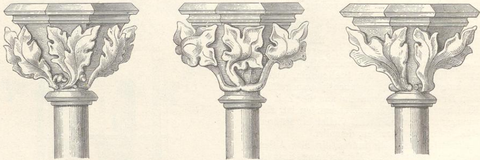
Fig. 115. (Prag.)

Auf der Tafel mit der Ansicht der Prachatitzer Kirche erblicken wir auch das Literatenhaus, es steht zur Rechten des Chores.