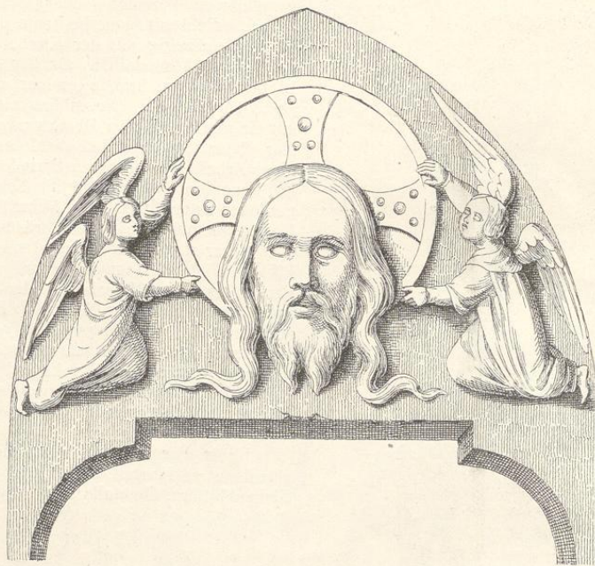
Fig. 124. (Nimburg.)

abgetragenen S. Johanneskirche angebracht gewesen und um 1820 an die gegenwärtige Stelle versetzt worden sei. Die wiederholt ausgesprochene Behauptung, dieses Werk habe das Bogenfeld des ehemaligen Eingangs der frühromanischen Johanneskirche gebildet, wird schon durch das bescheidene Breitenmass von 22 Zollen (57 Cm.) widerlegt, davon abgesehen, dass die Behandlung aller Theile das Zeitalter Karl's verräth. Die überaus fleissige und geglättete Arbeit ist sehr wenig vertieft und ragt an den höchsterhabenen Stellen nicht über 6 Cm. aus dem Grunde empor; als Materiale wurde der übliche Mergelstein benützt.