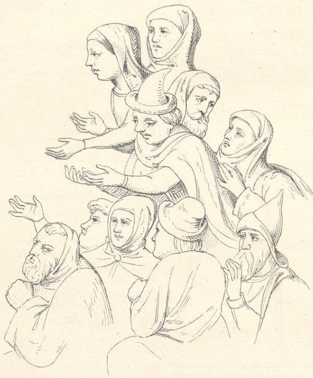
Fig. 129. (Prag.)

Carolus Romanorum Imperator et Bohemiae Rex anno Domini MCCCXLIII Claustra haec aedificavit et pieturis ornavit. Restauratae et repictae sunt anno MCDXII. iterumque MDLXXXVIII et MDXCIV. et tandem accuratius et melius MDCLIV. —