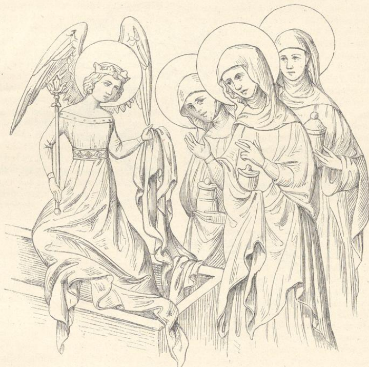
Fig. 130. (Hohenfurth.)

Haben anfänglich nur Italiener im Kreuzgange gearbeitet, scheinen sich doch bald Schüler herangebildet zu haben, welche die Arbeiten fortsetzen konnten;