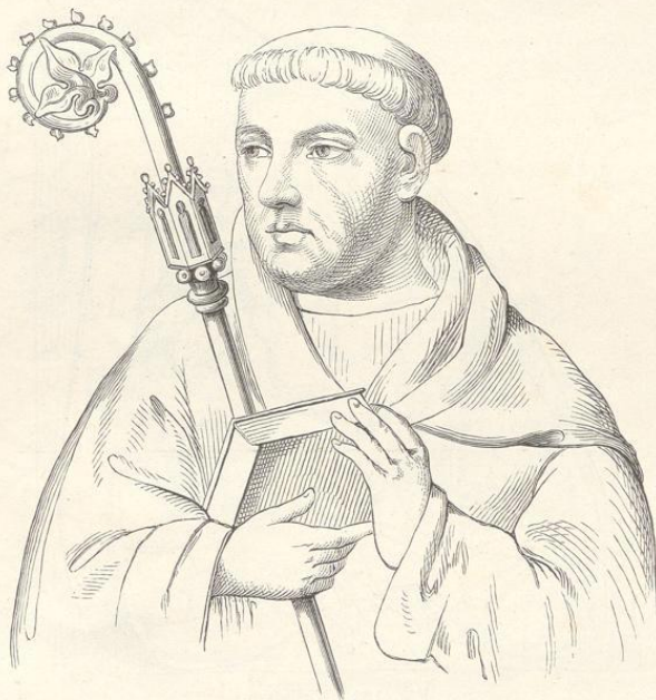
Fig. 132. (Karlst.)

Eines der besterhaltenen Werke dieser Richtung, entweder ganz aus der Hand Wurmser's hervorgegangen oder unter seiner Aufsicht angefertigt, wird in der Dechantenkirche zu Beneschau seit Jahrhunderten verehrt und zwar als Hochaltarbild. Dieses Gemälde stellt die unbefleckte Empfängnis dar: Maria steht in ganzer lebensgrosser Figur auf der Mondsichel, das Kind auf dem linken Arme haltend, während die Rechte den Mantel leise anzieht. Die Figur scheint im Vorwärtsschreiten begriffen und tritt der um den Mond sich herumwindenden Schlange aufs Haupt. Die oberen Ecken