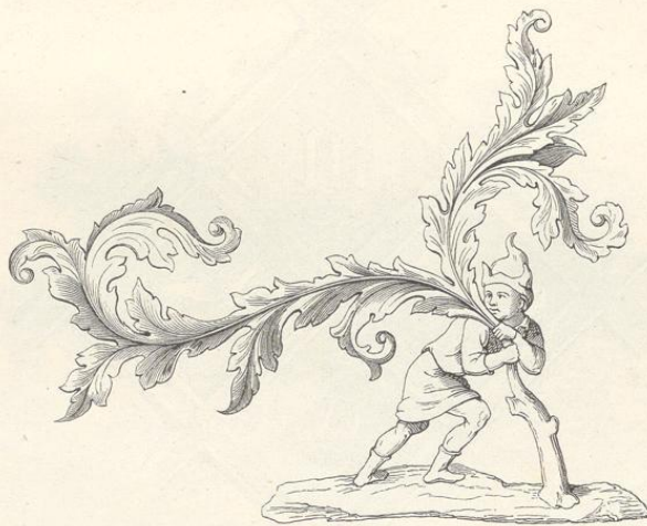
Fig. 137. (Prag, Museum.)

Reste von Glasbildern, welche dem XIV. Jahrhundert entstammen, sind unbedeutend und gehören nur kleineren Zusammenstellungen an. Bruchstücke dieser Art sieht man in der Katharinen-Capelle zu Karlstein und in einigen Sammlungen. Künstlerischen Werth besitzen nur zwei in der Bartholomäus-Kirche zu Kolin vorhandene Theile eines grösseren Bildes, welches die Geschichte der heiligen Jungfrau Maria zum Inhalt hatte und das wohl ein Geschenk des Kaisers Karl sein mochte. In dem besser erhaltenen Flügel ist der Tod Marias dargestellt und zwar nach der oben erwähnten Tradition, dass Christus zwischen den versammelten Jüngern erschienen sei und die Seele, welche die Gestalt eines kleinen Kindes hat, der Scheidenden abgenommen und in den Himmel geführt habe. Die sterbende Jungfrau liegt ausgestreckt auf einem Ruhebette, hinter welchem Christus steht, dessen überirdische Erscheinung durch die Mandorla ausgedrückt ist. An jeder Seite sind sechs Apostel angebracht, von denen aber nur die Köpfe