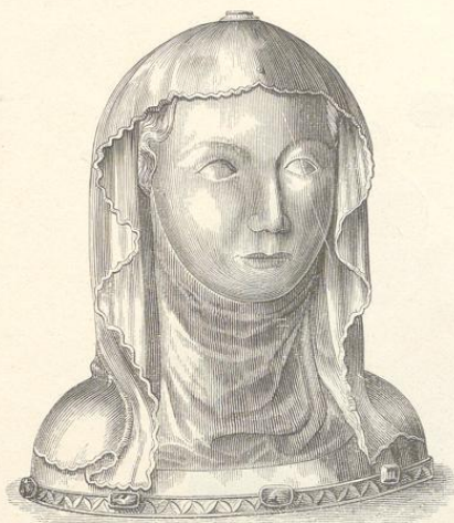
Fig. 140. (Prag.)