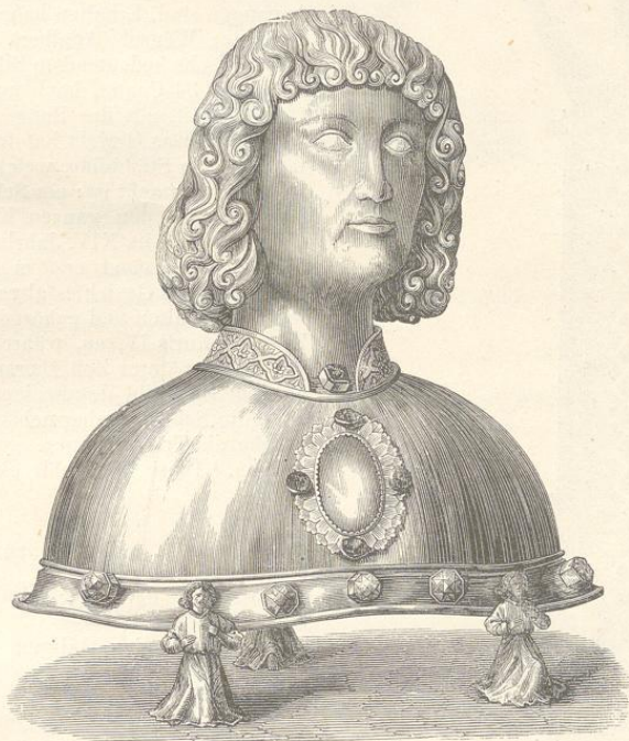
Fig. 141. (Prag.)

Als beglaubigte Werke der böhmischen Goldschmiede- und Ciselirkunst nennen wir vor allen die auf