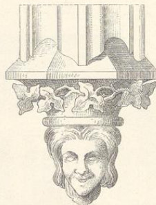
Fig. 153. (Libiš.)

Ein merkwürdiges und zugleich völlig unbekanntes Baudenkmal, angeblich von Karl IV. gestiftet, eher jedoch aus der Zeit des Königs Wenzel herrührend, besitzt die Stadt Brüx in der mit einem Armenhause ver- bundenen Heilig-Geist-Capelle, deren Masse und sonstige