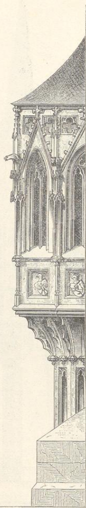
Fig. 164. (Prag.)

Ansicht der Rathhauscapelle. Fig. 163. (Im Texte S. 149.)