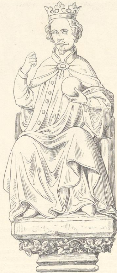
Fig. 165. (Prag.)

Thürme und die Anfertigung der Standbilder, welcher Umstand bei Besprechung des Thorthurmes hervorgehoben worden ist. Diese Figur ist in grossen Linien entworfen, die Haltung naturgemäss und zugleich vornehm, der Ausdruck des Gesichtes edel. Da das Bildwerk in seiner Eigenschaft als Porträt späterhin bedacht wer-