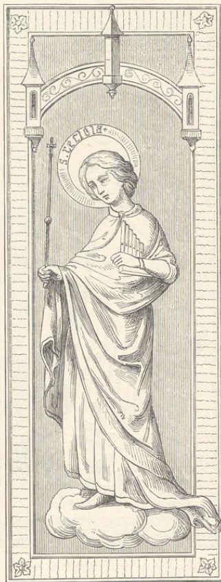
Fig. 169. (Mühlhausen am Neckar.)

XIV. Jahrhundert angehören und sowohl in Bezug auf Anordnung wie Farben-Technik der böhmischen Schule verwandt sind, während es von den Wandgemälden im Chore und am Triumphbogen (welche, nebenbei gesagt, übermalt worden sind) erwiesen ist, dass sie der schwäbischen Schule angehören. Die zahlreichen in der Kirche befindlichen Schnitzarbeiten, Stein-Sculpturen und Altarbilder gehören nicht mehr der Stiftungszeit an, sondern sind spätern schwäbischen Ursprungs. Da ein Eingehen auf diese Werke von dem hier gestellten