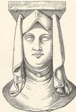
Fig. 167. (Brüx.)

ligen-Geistcapelle zu Brüx angebrachten weiblichen Büsten die Vermuthung ausgesprochen, dass wohl Beguinen dargestellt sein möchten. Es bestanden in Böhmen nur die beiden Orden der Clarissinnen- und weissen Magdalener-Nonnen, welche sich mit Armen- und Kranken-