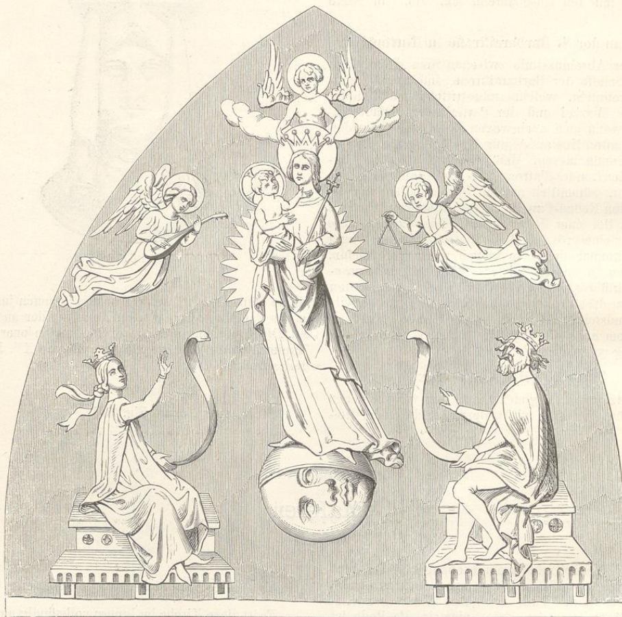
Fig. 168. (Libisch.)

gung — Maria und Elisabeth — Geburt — Beschneidung — Taufe — Versuchung — die zwei Bilder der obersten Reihe sind ganz verdorben — (Südwand) Christus im Grabe — Auferstehung und vielleicht das Jüngste Gericht. Alle übrigen Bilder sind bis auf einige Flecken verblasst, ebenso verhält es sich mit den Gemälden an der westlichen Wand. Am Triumphbogen ge-