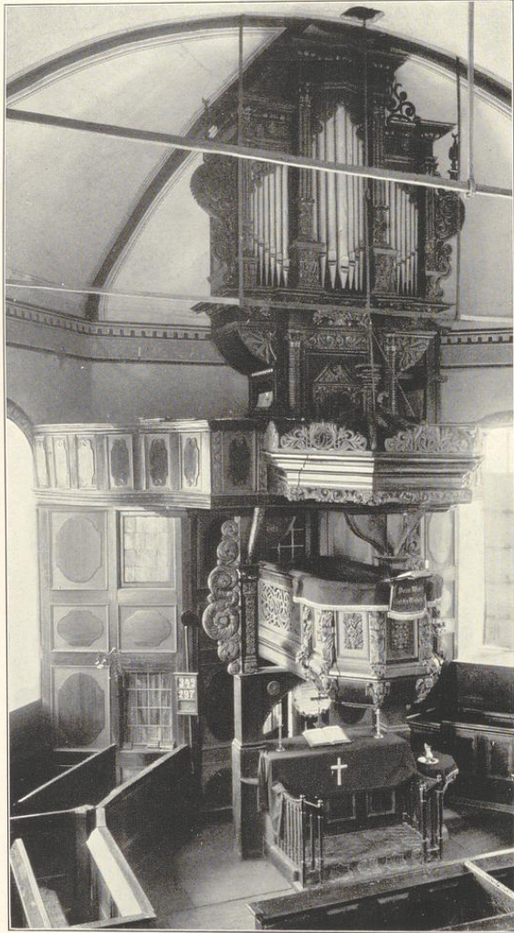
Altar, Kanzel und Orgel.