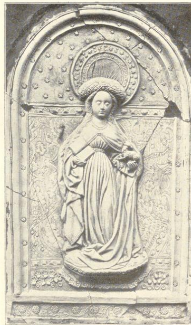
Agnes, Relief von Judocus Vredis. (Siehe Karthaus, Seite 95.)