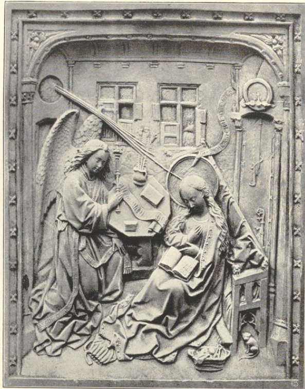
Mariä Verkündigung, Relief von Jndocus Vredis. (Siehe Karthaus, Seite 93.)