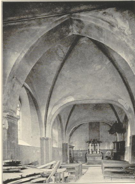
Innenansicht nach Nordosten.