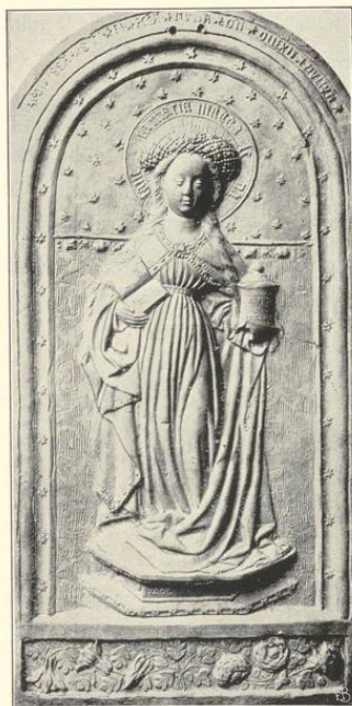
Magdalena und Dorothea (Bischöfliches Museum Münster), Reliefs von Judocus Dredis. (Siehe Karthaus, Seite 93.)