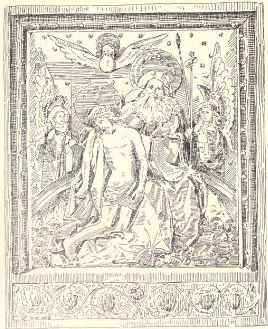
Dreieinigkeith. Relief von Judocus Vredis. (Siehe Karthaus, Seite 93.)