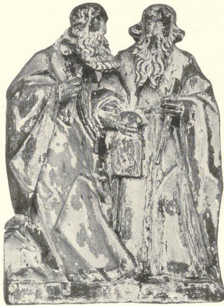
Apostel, gothisch, von Holz, 55 cm hoch, aus dem Kloster Gravenhorst; jetzt im bischöflichen Museum zu Münster.