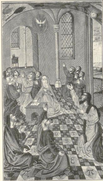
Miniatur aus einem Gebetbuch im Schloß Surenburg. (Siehe Seite 91.)