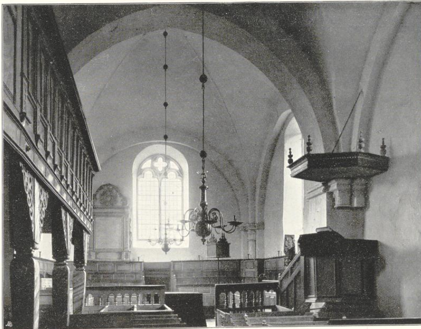
Etichés von Alphons Bruchmann, München.