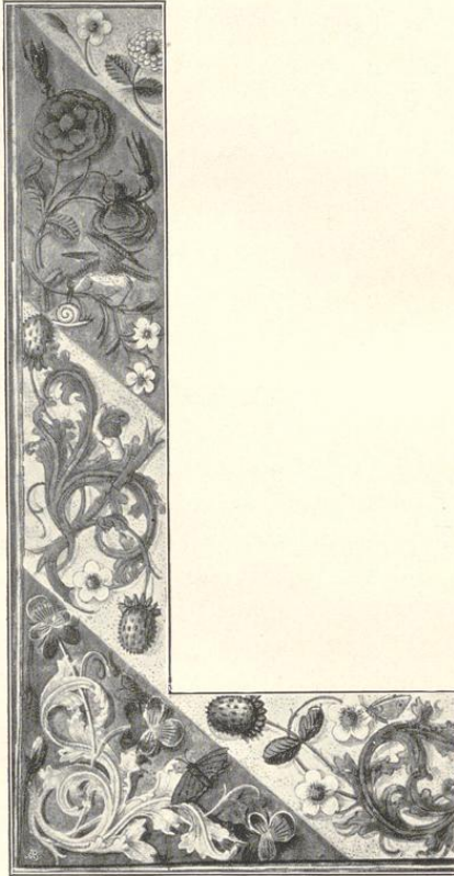
Randverzierung aus einem Pergament-Manuskript im Schlosse zu Surenburg. (Siehe Seite 91.)