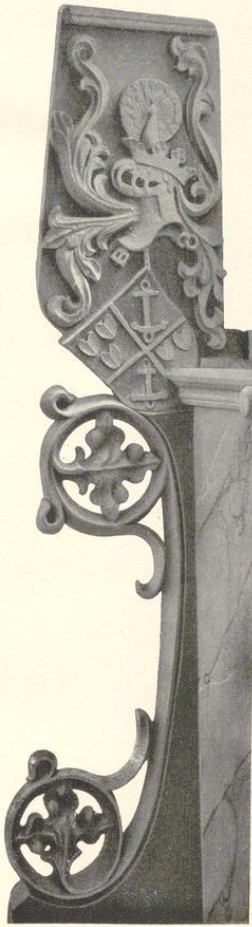
Eudorff, Bau- und Kunstdenkmäler von Westfalen, Kreis Tecklenburg.