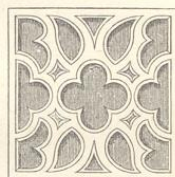
Fig. 52. (Blatna.)

Chor besteht aus vier Gewölbefeldern, ist 62 Fuss lang und 26 Fuss weit, welche Weite sich auch in dem rechtsseitigen (südlichen) Schiffe fortsetzt. Diese beiden Partien halten die gleiche Mittellinie ein, so dass das nördliche 18 Fuss breite Nebenschiff als späterer Anbau erscheint, obwohl gerade hier die ältesten und kunstreichsten Theile vorkommen. Drei rechteckige Pfeiler trennen die Schiffe, in deren westlichem Joche eine Empore eingebaut ist. Der Aussenbau verspricht so wenig, dass selten ein Reisender in die 1421 durch Žizka, dann 1620 durch Herzog Maximilian von Bayern und 1722 durch eine ungeheure Feuersbrunst zerstörte Kirche eintritt. Unter der Empore und im nördlichen Schiffe kommen auch rippenlose Gewölbe, jedoch von geringer Durchbildung vor.