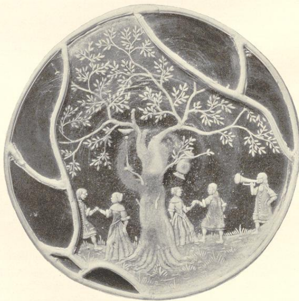
Glasbild (Nothof), 18 cm Durchmesser (Sammlung Thomée zu Altena).

Das letzte Jahrhundert war für unsern Kreis eine Zeit großartiger wirtschaftlicher Entwicklung. Die Ofenmundfeuer sind erloschen, die so malerisch in die schönen Waldthäler eingebetteten Eisenhämmer verstummt, als mit der Dampfkraft die Großindustrie ihren Einzug hielt.