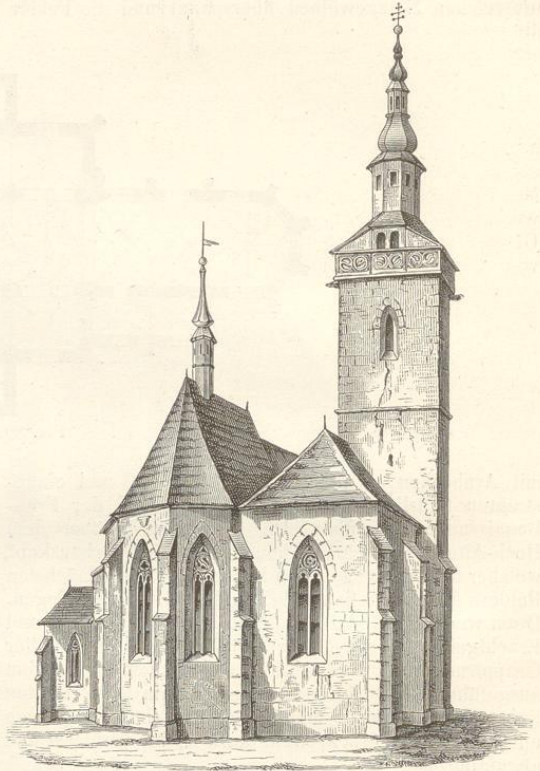
Fig. 83. (Arnau.)

schon bei dem Eintritt erkennen, indem Chor und Schiff keine gemeinschaftliche Mittellinie einhalten, sondern die Achse dieser beiden Räume um 10 Fuss auseinander fällt. Die Ursache dieser befremdenden Anordnung ist nicht bekannt; wahrscheinlich blieben bei dem Brande die nördlichen Umfassungsmauern des Schiffes in solchem Stande, dass sie beibehalten werden konnten, während die der Südseite zusammenstürzten. Da auch der Chor in der Hauptsache beibehalten wurde, scheint man aus übertriebener Sparsamkeit die südliche Umfassungsmauer und das dortige Nebenschiff einwärts gerückt und so das Langhaus verkleinert zu haben, ohne auf Symmetrie und Aesthetik Rücksicht zu nehmen.