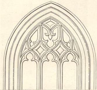
Fig. 88. (Laun.)

Diese schöne Kirche, deren wohlerhaltener Chor dem Schlusse des XIII. Jahrhunderts entstammt, wurde bereits im zweiten Bande S. 83 flüchtig beschrieben