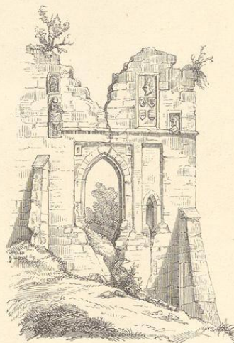
Fig. 105. (Litz.)

dem das Schloss während der ungeordneten Regierung des Königs Johann abgebrannt und nicht wieder hergestellt worden war, erbaute Karl IV. auf dem Hradschinplatze zwischen 1333—1340 eine neue Residenz, welche jedoch im Laufe der Bürgerkriege theils durch zufällige Brände, theils weil die nöthigen Reparaturen unterblieben, einging. Poděbrad, welcher einfach lebte und wie wir gelegentlich des Litzter Baues ersehen haben, sich mit bescheidenen Räumlichkeiten zu behelfen wusste, konnte bei seinen unendlichen Geschäften an keinen Neubau denken; der prachtliebende König Vladislav II. aber fand für gut, einen durchaus neuen Palast an Stelle des von Kaiser Karl errichteten herstellen zu lassen. Dem Beneš von Lann wurde die Leitung dieses Baues übertragen, von welchem der östliche Flügel sich in unversehrtem Zustande bis auf unsere Tage erhalten hat und noch immer benützt wird. Die wichtigste Partie dieses Bauwerkes ist der nach dem Bauherrn also genannte Vladislav'sche- oder Krönungs-saal, eine höchst imposante Halle von 170 Fuss Länge, 49½ Fuss Breite und 45 Fuss Höhe, mit einem viel-