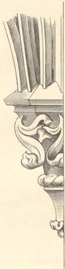
Fig. 123. (Kuttenberg.)

Der Thorthurm ist 28 Fuss breit, bis an das Hauptgesims 60 Fuss hoch, und oberhalb desselben mit Eckthürmchen und einem 11 Fuss hohen Kranze von Créneaux umgeben. Das flache Dach wird durch die Zinnen verdeckt und ist gegen einwärts geneigt; für den Abfluss des Regenwassers sind besondere Vorkehrungen angebracht. Ueber der spitzbogigen Thoröffnung tritt ein von Kragsteinen unterstütztes Postament vor, auf welchem in früherer Zeit das Standbild Peter III. von Rosenberg gestanden haben soll. Die