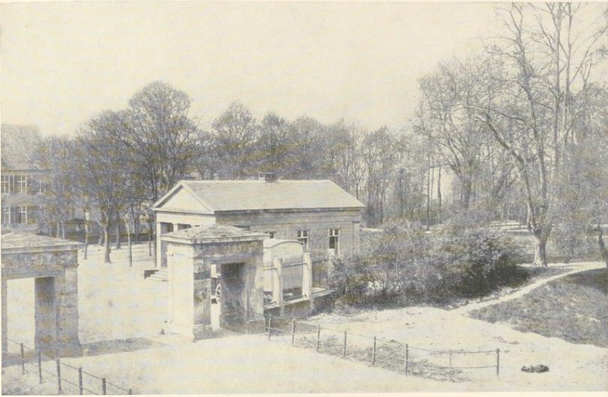
Abb. 137. Das Mauritztor, Ansicht nach Nordwesten Aufnahme: Hundt-Münster, um 1880

1880—1888 46 . Beseitigung der Wasserrinne zwischen Servatii- und Mauritztor 47 und zwischen Hörstertor und Zwinger, Abbruch des südlichen Wasserbären zwischen Hörsterkaserne und Gartenstraße, Beseitigung des Außengrabens zwischen dem zweiten Bär und dem Bären am Zwinger, Abtragung des Promenadenwalles zwischen Hörstertor und Zwinger (Abb. 138) und Schaffung der Anlagen vor dem Franziskanerkloster 48 .