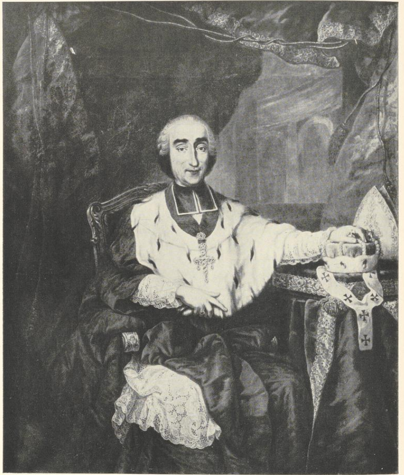
Abb. 135. Der Bauherr der Promenaden 1772: Fürstbischof Max Friedrich Graf v. Königsegg-Rothenfels Ölgemälde von Matthias Kappers 1763, im Besitze der Stadt