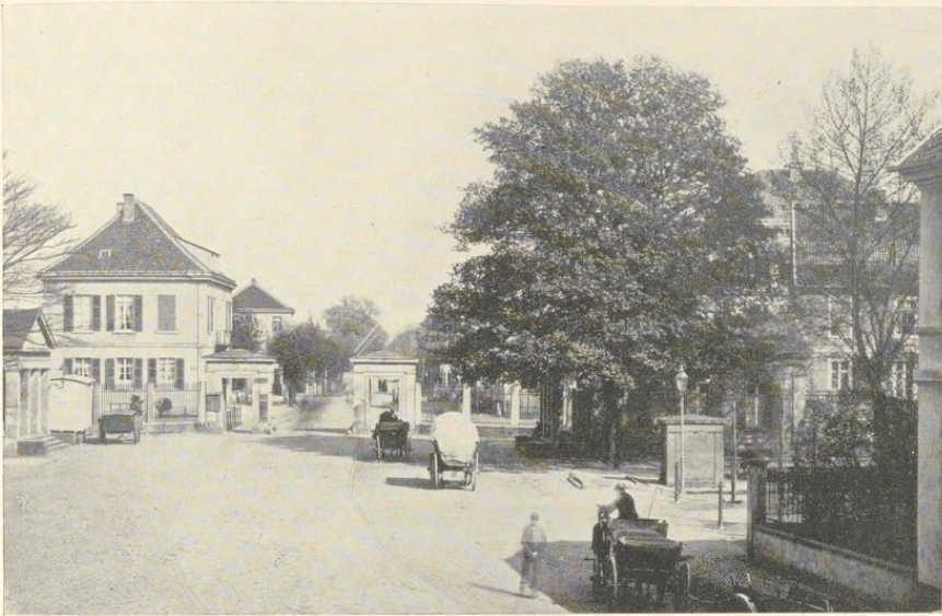
Abb. 136. Das Mauritztor, Ansicht nach Osten um 1880

rund um die Altstadt ohne Unterbrechung führende Allee zu schaffen, zwar im Prinzip durchgeführt. Aber ihr Verspringen vom Abschnittstor bis zur Badestraße bzw. Neuplatzallee, das für die Führung des Fahrweges zwei rechte Winkel mit sich bringt, hat auch ein Genie wie jenes Lippers nicht zu beseitigen gewußt. Welch schwere künstlerische Schädigung des Schlosses ihre Anlage bedeutete, betonte H. Geisberg schon 1866 in seinen Merkwürdigkeiten der Stadt , S. 52.