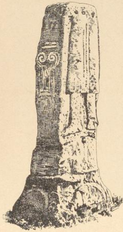
Rest eines romanischen Steinkreuzes mit Skulpturen, 1,45 m hoch; früher in der Bauerschaft Barle, Kirchspiel Wüllen, jetzt zu Haus Sonderhausen, bei Ahaus (Freiherr von Schorlemer-Alt).

Eudorff, Bau- und Kunstdenkmäler von Westfalen, Kreis Ahaus.