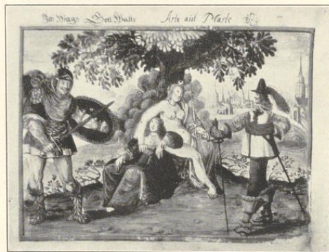
Aus einem Pergament-Manuscript des Vereins für Orts- und Heimathkunde zu Altena.