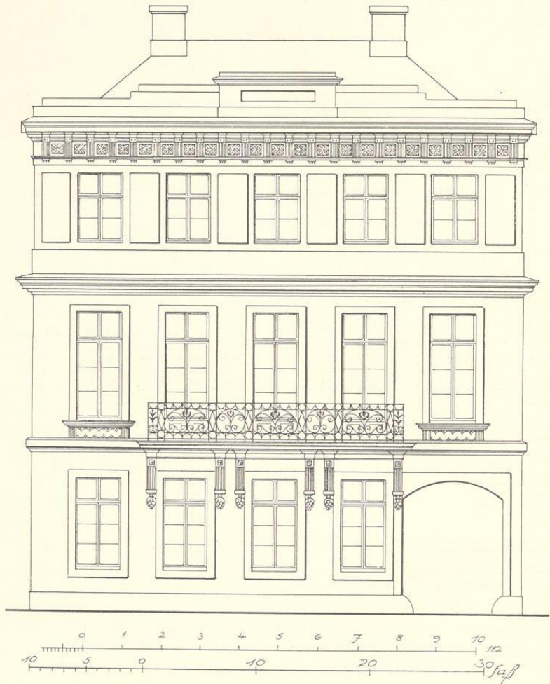
Abb. 296. Aufriß der Westfront der ehemaligen Siegelkammer nach dem Umbau durch August Reinking, 1816/7 Zeichnung Nr. 307 (Pause), Maßstab 1:100

das Amt des Siegelers vgl. Josef Jeiler im 64. Bande der Zeitschrift (1906), S. 136 3 . Zu Beginn des 18. Jahrhunderts war das Gebäude in so schlechtem Zustande, daß die Siegeler