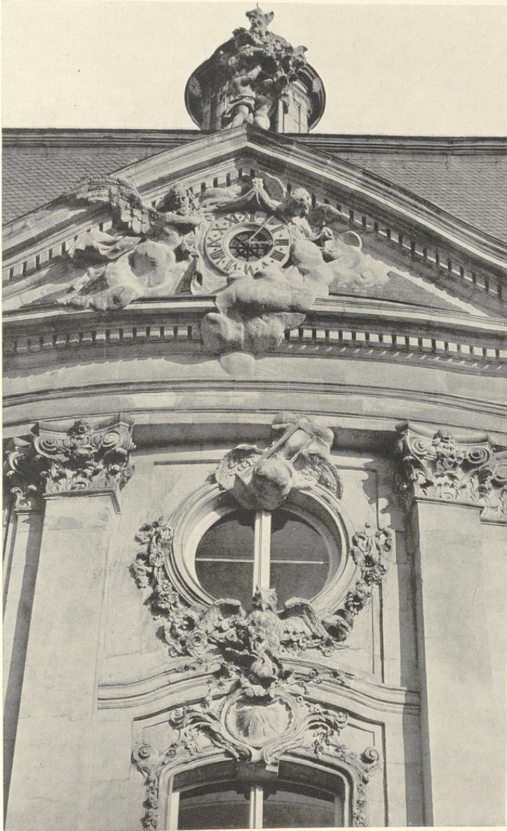
Abb. 216. Die Mittelachse des Hauptpavillons auf der Westseite