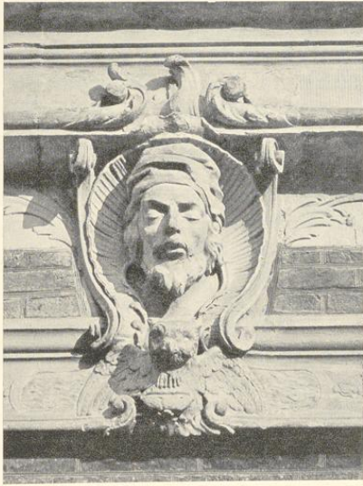
Abb. 214. Die Nacht

Die Schlußsteine der Seitentüren des Hauptpavillons auf der Westseite