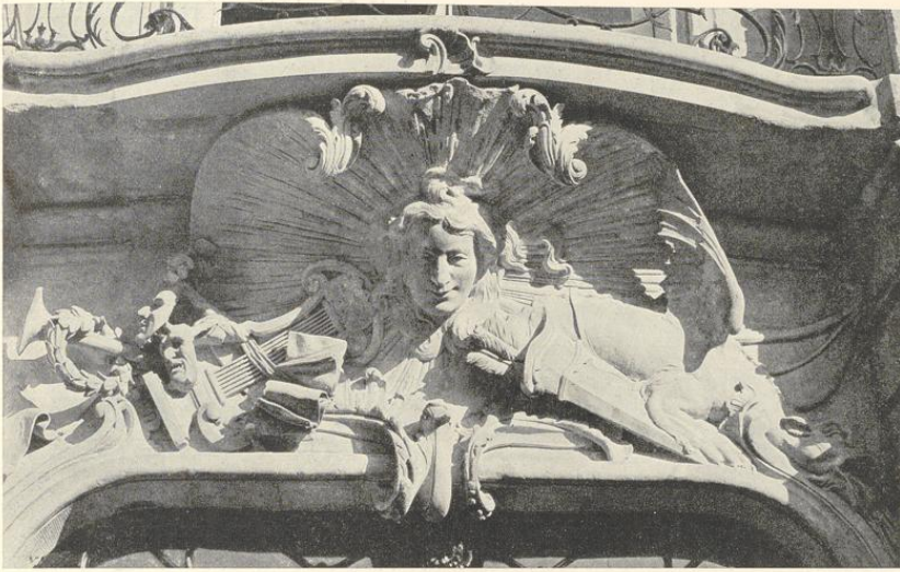
Abb. 210. Die Bekrönung des Mittelportales auf der Westseite Der Hauptplanet: die Sonne

dessen Südwand wegen der darin untergebrachten Kapelle eine Bogenlinie bildet, steigt sie in der Mittelachse auf 60' (17,45 m). Die Außenecken beider Pavillons liegen je 10' (2,9 m) jenseits der Außenfluchten der zugehörigen Flügel, die einander zugewendeten Schmalseiten der Pavillons 3' (0,87 m) vor den Fluchten ihrer Flügel. Der Abstand der letzteren voneinander beträgt demnach 246' (71,58 m), jener der Pavillons 240' (69,83 m). Von der Länge des Corps de logis auf der Ostseite zwischen den Flügeln mit 246' (71,58 m) entfallen 80' (23,27 m) auf den Mittelpavillon und je 83' (24,15 m) auf die an letzteren sich auf beiden Seiten anschließenden Seitenteile. Vom Corps de logis aus messen die den Ehrenhof einschließenden Flügel ausschließlich ihrer Pavillons 49' (14,26 m), einschließlich derselben 86' (27,02 m). Die größte Ausdehnung des Schlosses beträgt demnach, abgesehen von der nachträglichen Erweiterung des Küchenpavillons, 101,83 m von Norden nach Süden, 45,24 m von Osten nach Westen.