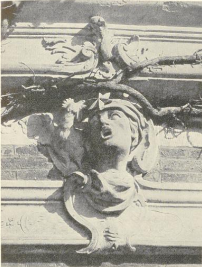
Abb. 211. Der Morgen