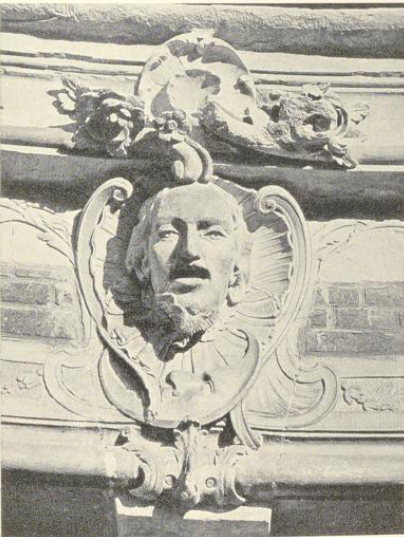
Abb. 213. Der Abend