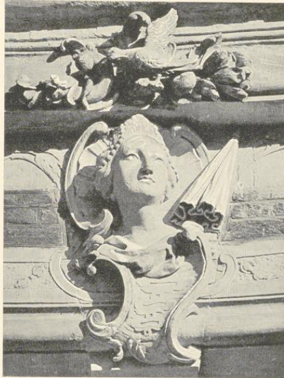
Abb. 212. Der Mittag