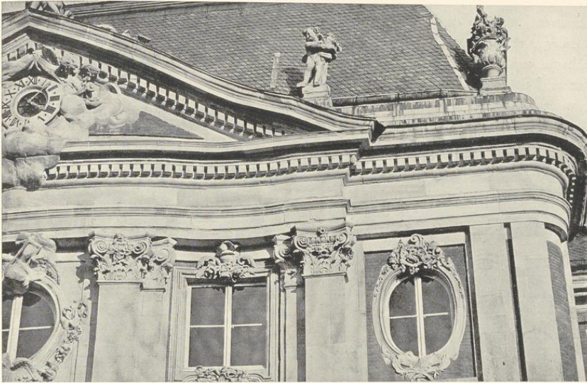
Abb. 215. Das Gebälk über den Pilastern des Hauptrisalits auf der Westseite

betonte Mittelteil des Pavillons biegt sich auf beiden Fronten in einer Schlangenlinie nach außen, deren Ausschlag auf der Westseite sehr gering ist, während auf der Ostseite die mit den Säulen besetzte Mitte eine Kreislinie bildet, deren Mittelpunkt in der Mitte des Pavillons liegt (vgl. Abb. Nr. 182). Die den äußeren Halbsäulen korrespondierende Schrägstellung der Eckpilaster verleiht den letzten Fünfteln eine entgegengesetzte Biegung, die besonders in dem Gebälk des Giebels stark zum Ausdruck kommt.