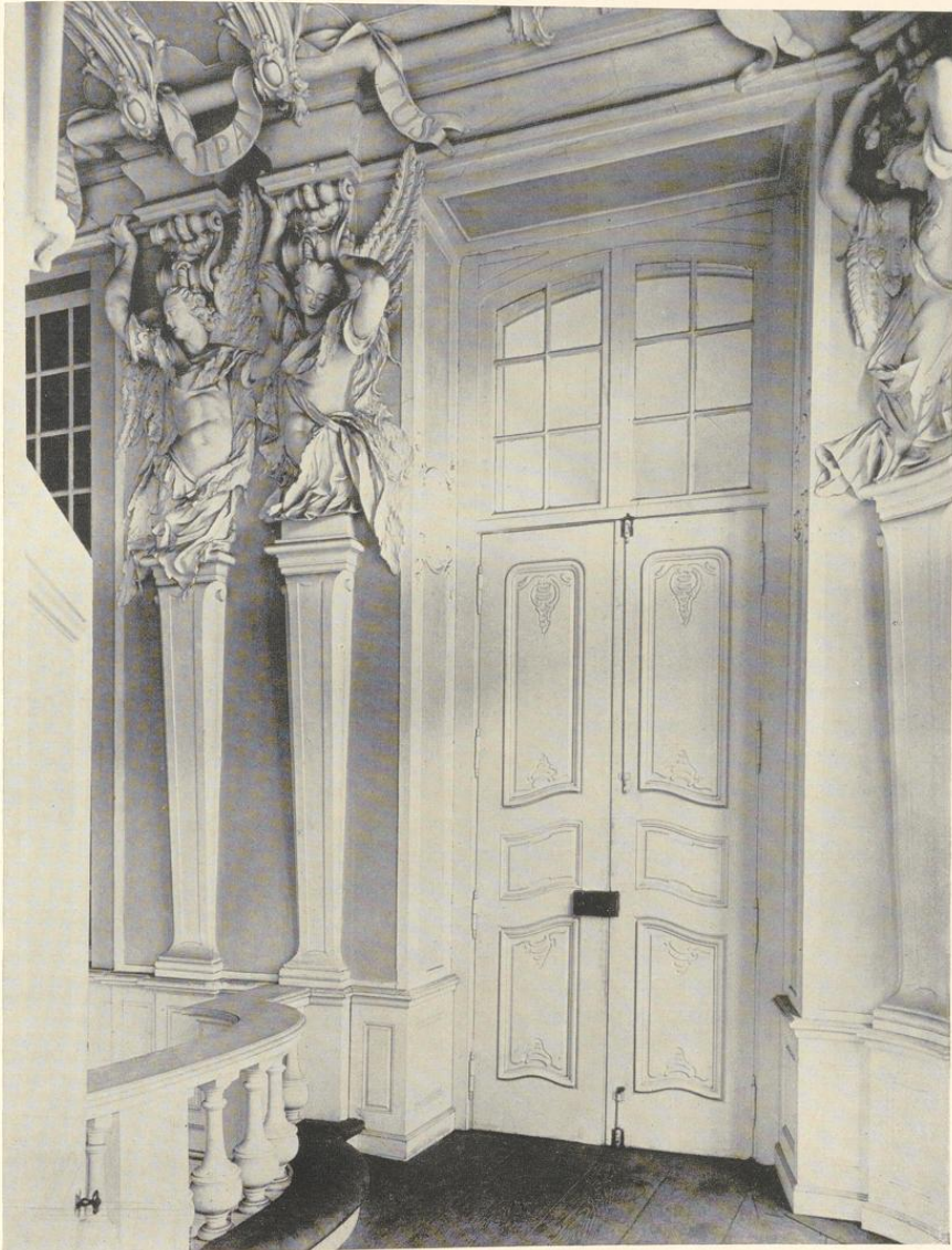
Abb. 224. Inneres der Kapelle, Westtür der nördlichen Tribüne