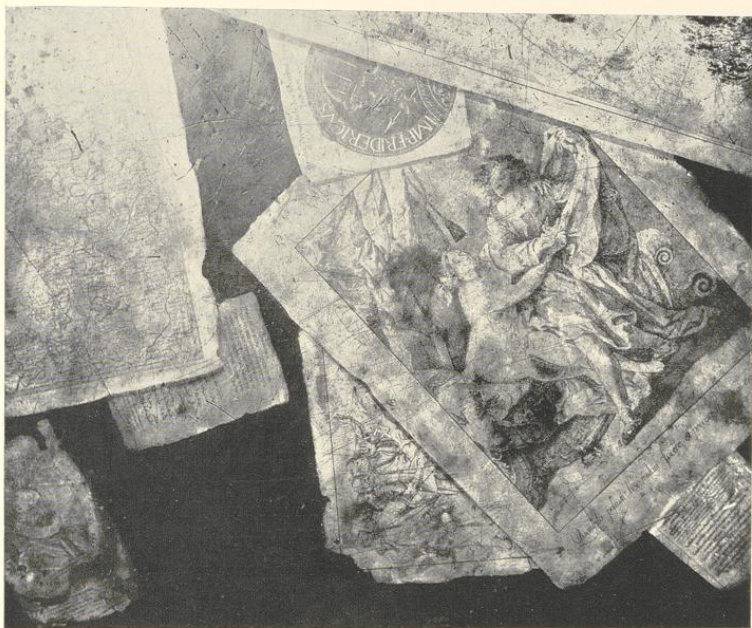
Abb. 272. Teilaufnahme der Platte eines Tisches aus dem Besitze des Fürstbischofs Klemens August von Bayern

Oben: Ob. 1632 , rechts Anno 1606 . Oben rechts Doppel-Wappen Loe (Spießen Tafel 198 Nr. 6) und v. d. Horst (Spießen Tafel 177 Nr. 6) 42 .