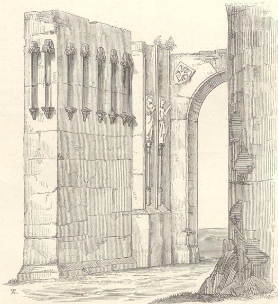
Fig. 204 (Jungfer-Teinitz.)

Die Kreuzarme treten um die Breite eines Nebenschiffes aus der allgemeinen Umfassungslinie vor, sind aber durch die Restauration zu Capellen und Oratorien umgewandelt worden. Unterhalb der Pultdächer, welche