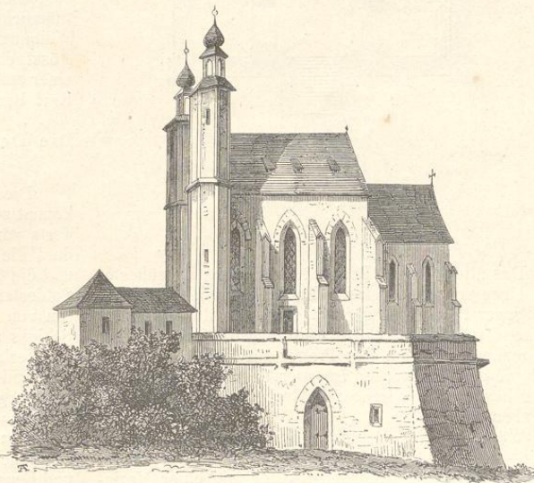
Fig. 226. (Sedlec.)

Bau-Periode entstammt nur das Presbyterium mit dem aus fünf Seiten des Zehnecks construirten Chorschlusse. Diese Partie ist einheitlich, mit einfachen Kreuzgewölben überspannt und gewährt durch seine ergiebige Weite von 32 Fuss einen eben so wohlthuenenden als kirchlichen Anblick. Das 125 Fuss lange und 80 Fuss breite Langhaus scheint zwar in seinen allge-